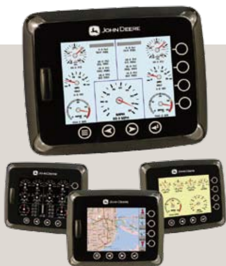
Tableaux de bord